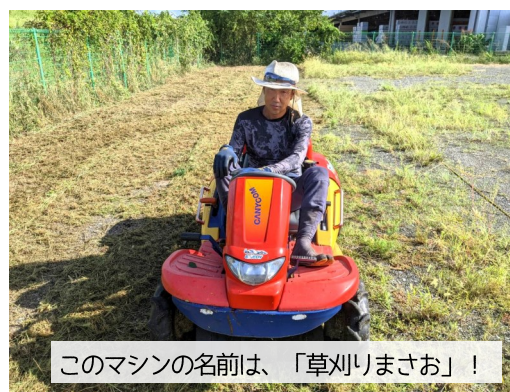
このマシンの名前は、「草刈りまさお」！

そのおかげもあってか、仲間全員がこの夏をなんとか乗り切ってくれました。これが一番うれしいことでした。お客さまは当然大事なのですが、はたらく仲間と同じくらい大事です。全員元気だったことが、何よりです。